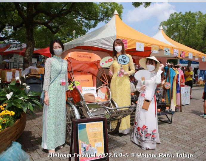
Vietnam Festival 2022.6.4-5 @ Yoyogi Park, Tokyo