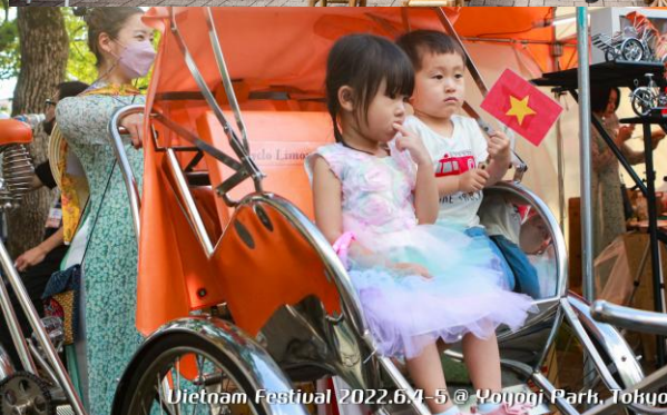
Vietnam Festival 2022.6.4-5 @ Yoyogi Park, Tokyo