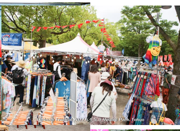
Vietnam Festival 2022.6.4-5 @ Yoyogi Park, Tokyo