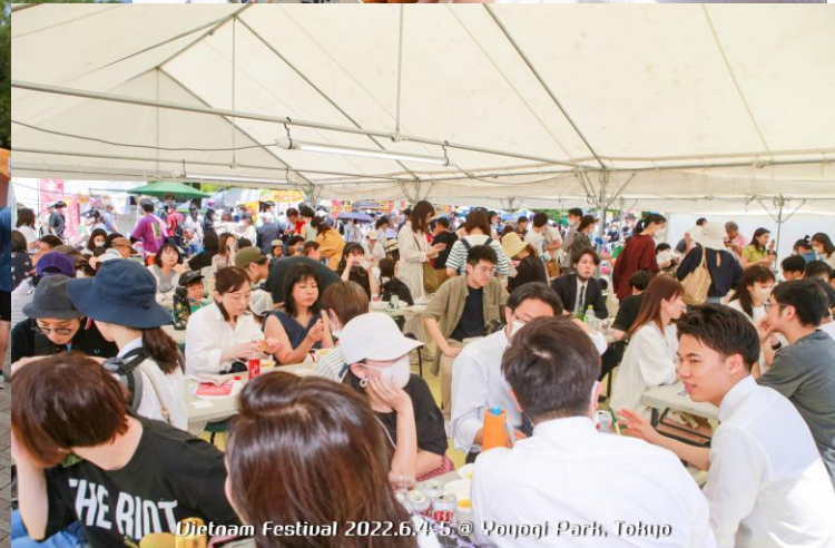
Vietnam Festival 2022.6.4-5 @ Yoyogi Park, Tokyo